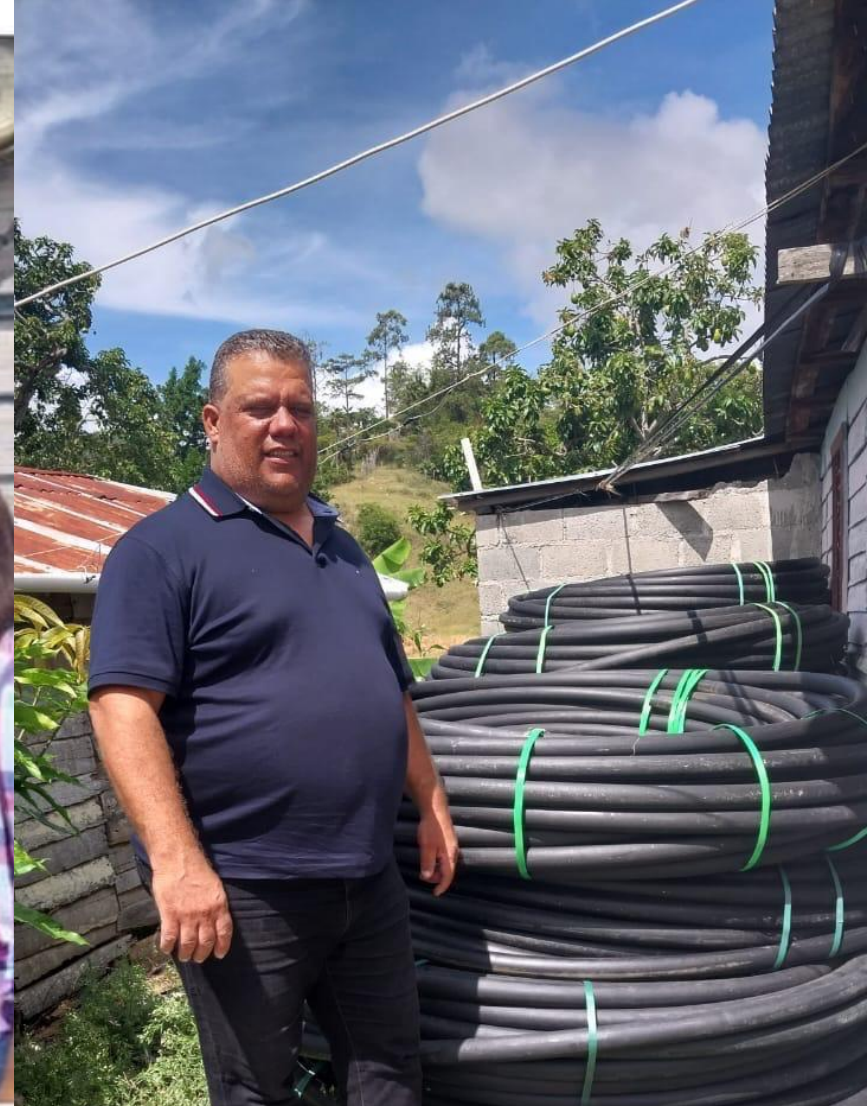
Entrega de mangueras a la comunidad de “Los Palmaritos “