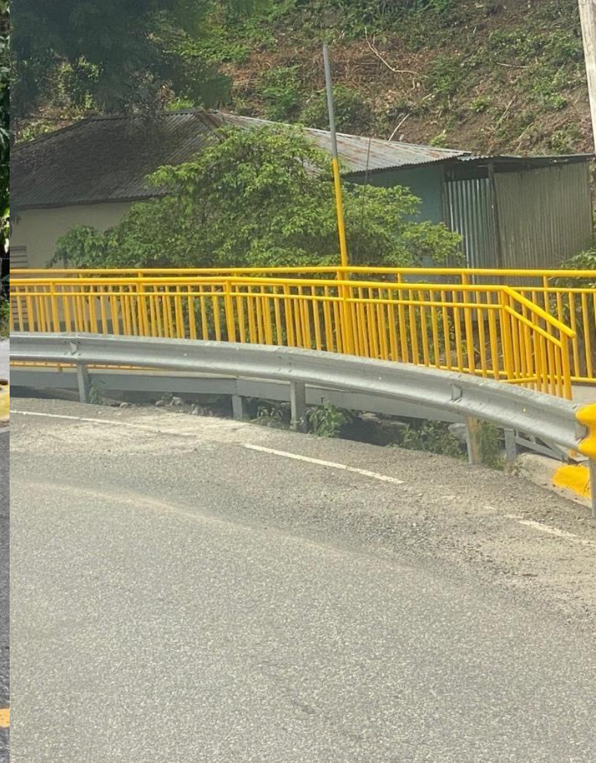
Construcción del pase peatonal “Cañada de Colá El Pinar .