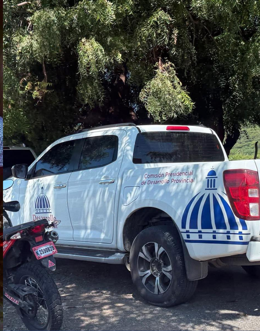
Seguimiento a la terminación de la construcción del Play Máximo Mancebo