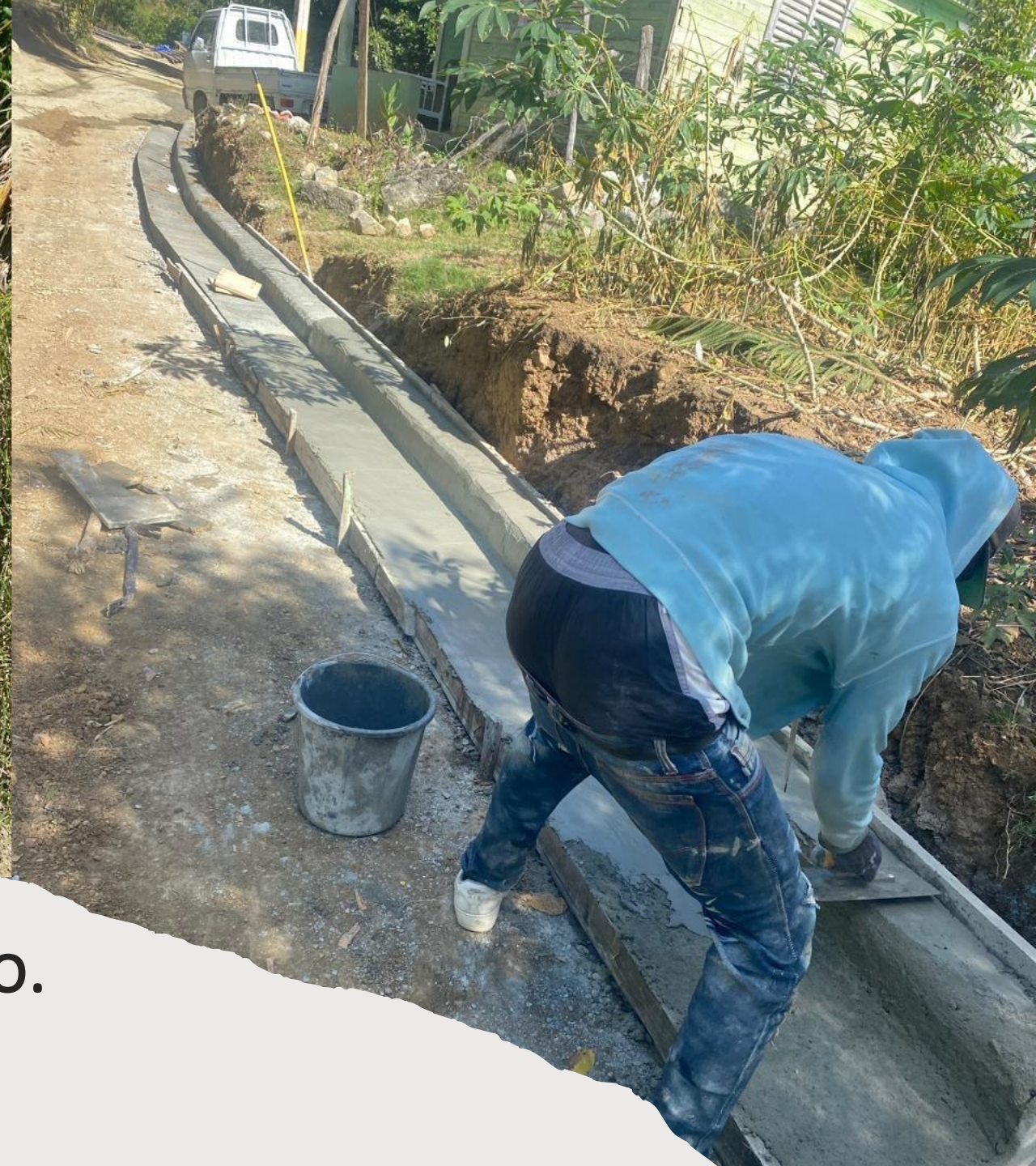
Contenes en Los Corozos abajo.