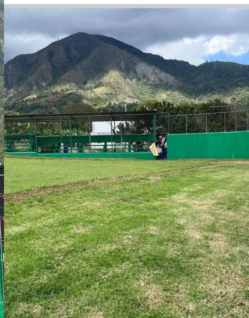
Mantenimiento del Play de béisbol “La Ciénaga”