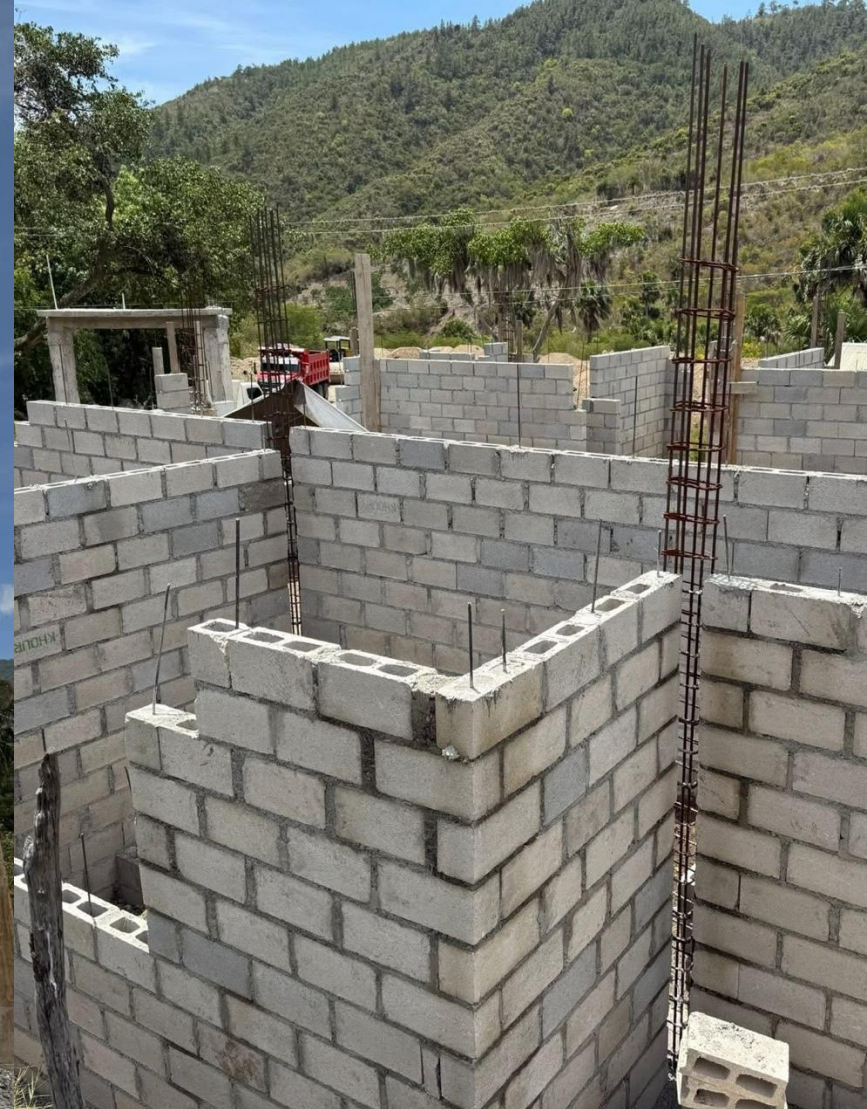
Seguimiento a la construcción del Centro Comunal “Los Tramojos”